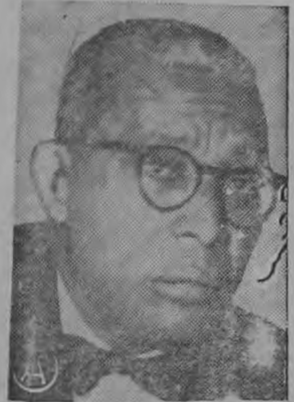
Dictador DUVALIER...asesina estudiantes que se le enfrentan...

Las primeras informaciones dijeron que siete personas habían sido arrestadas. Aunque no se expidió ninguna declaración oficial, fuentes allegadas al Ministerio del Interior dijeron que solo cinco personas fueron detenidas. Varias otras fueron interrogadas y puestas en libertad.