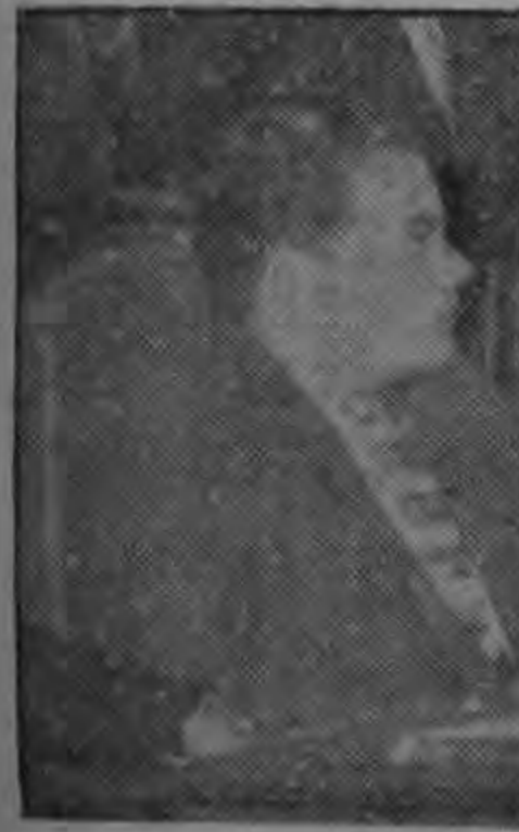
LUIS ALBERTO MONGE Ex-Secretario General de la OIT.

Industrial, podemos encontrar - nos ante el caso lamentable de que la industrialización nacional se frustra porque poco a poco la empresa costarricense va pasando al inversionista extranjero, y si la inversión nacional se frustra, podríamos decir en términos un poco chabacanos, pero muy gráficos, que al plazo de unos años al empresario costarricense le van a quedar las fábricas de papas tostadas, de churros y de maní garapinado, y al inversionista extranjero los buenos negocios de la industrialización nacional. Creo que la política industrial de Costa Rica debe orientarse hacia una protección definida, clara, de carácter nacionalista que no es chauvinista, que no es negativa, que no menosprecia la inversión extranjera.