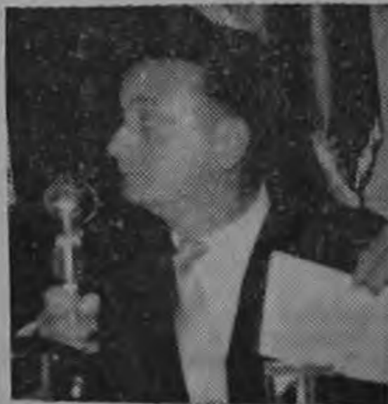
HERNAN GARRÓN Ministro de Industrias