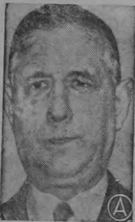
Presidente DE GAULLE ...fue frustrado un nuevo atentado contra su vida...

La Policía parisién informó ayer que frustró un nuevo complot para asesinar al Presidente De Gaulle. La conjura estaba preparada para cuando De Gaulle visitase el Colegio Militar. Entre los arrestados figuran una profesora del Colegio y un capitán residente en el mismo, según dijeron fuentes del Ministerio del Interior. Hay otros tres arrestados acusados de estar complicados en el complot. En casa de uno de ellos fue ocupado un rifle con mira telescópica